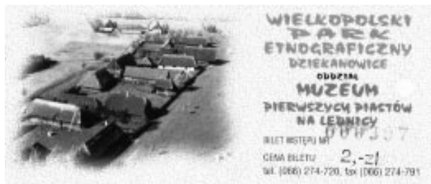
Het Poolse openluchtmeuseum (een van de vele).