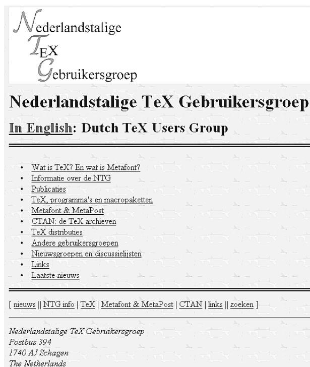
Figuur 1: De nieuwe hoofdpagina.

En onze eigen site, wel, we hebben het al gezegd, alle genoemde slechte eigenschappen kwamen daar samen. We boden wel veel informatie maar de toegankelijkheid en de kwaliteit kon beter. En wat te denken van die teller. Zoals met wel met meer sites het geval is, was duidelijk te zien dat het steeds uitbreiden de kwaliteit niet had bevorderd.